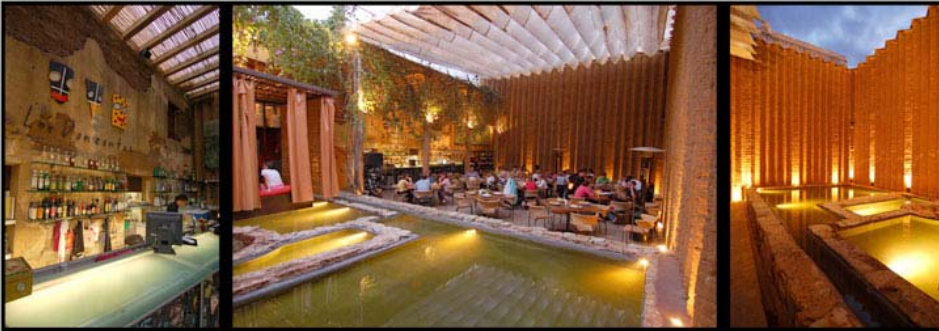
IMÁGENES ESPACIO ACTUAL, PROYECTO POSTERIOR "RESTAURANTE LOS DANZANTES"

PROYECTO: CASA VEA TIPO: RESIDENCIAL FECHA DE REALIZACIÓN: 2000 UBICACIÓN: ALCALÁ DE GARCÍA, CÁDIZ, ESPAÑA NOMBRE DEL PROYECTO: COMERCIAL PROYECTISTA: ALBERTO SOJAS DISEÑO: T.A.C.