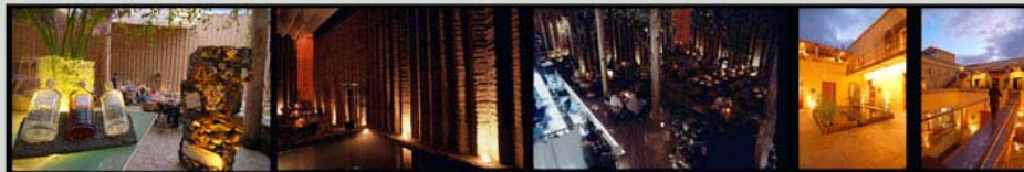
IMÁGENES ESPACIO ACTUAL, "RESTAURANTE LOS DANZANTES"