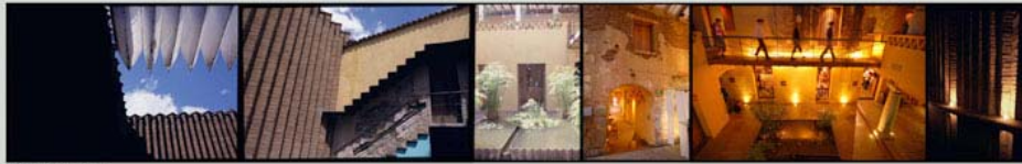
IMÁGENES ESPACIO ACTUAL